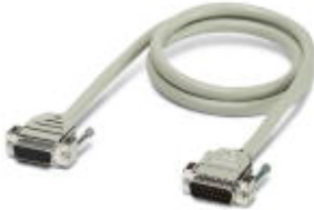
Konfektioniertes, geschirmtes Rundkabel, mit 25-poliger D SUB Buchsen- und Stiftleiste, Kabellänge: 3 m

Bitte beachten Sie, dass die hier angegebenen Daten dem Online-Katalog entnommen sind. Die vollständigen Informationen und Daten entnehmen Sie bitte der Anwenderdokumentation. Es gelten die Allgemeinen Nutzungsbedingungen für Internet-Downloads. ( http://download.phoenixcontact.de )